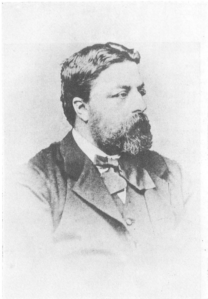
Leonce MULLE de TERSCHUEREN (Tielt 1830 - Nevele 1888)